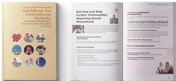
[프로그램 활용 교재]